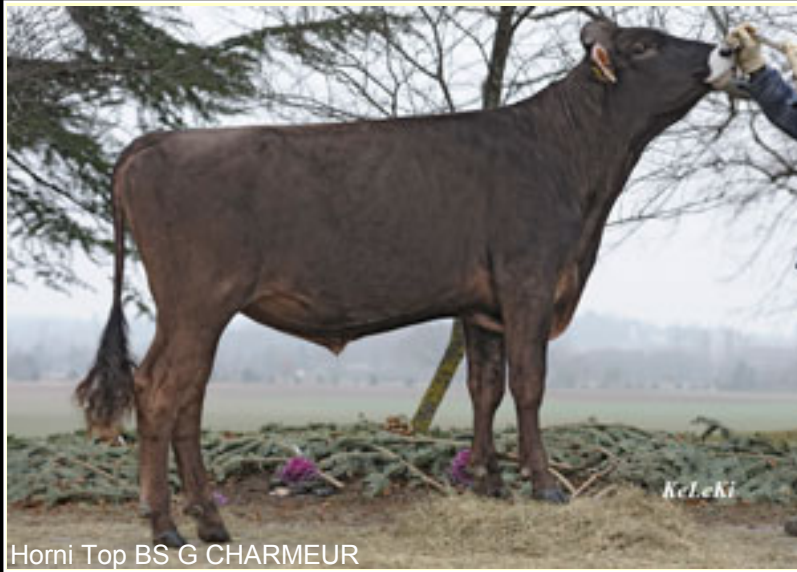
Horni Top BS G CHARMEUR

V: GLENN Schamaun BS Gord GLENN-ET *TM M: CHINA TopAZ Chester CHINA-ET MV: CHESTER Rolling View CHESTER-ET