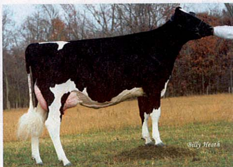
Frostys Mutter: Harvue Sam Heidi EX-93.

♀ Harvue Roy Frosty EX-95 (Roystone Jordan)