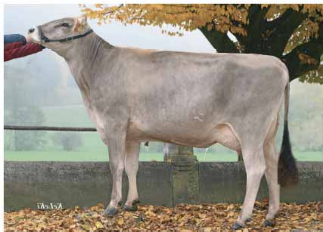
M: Gisler's Arrow JULI

GZW / VEG: 1'379 MIW / VL: 126 FIW / VF: 110 WZW / VEP: 122 GN / NG: 133