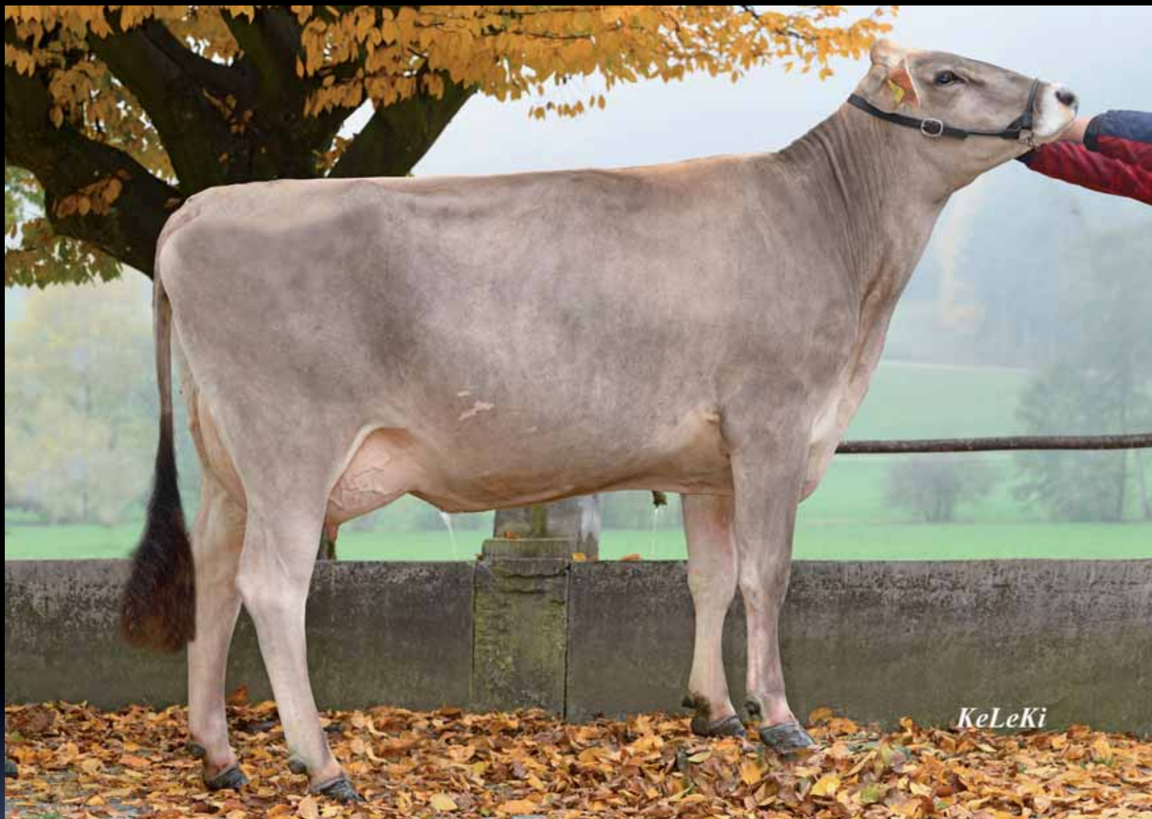
Gislars Arrow JULI Mutter von: Gisler's Superstar JULIUS