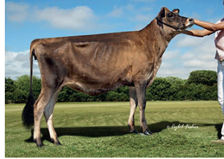
Day-Kel Magician Flirtatious