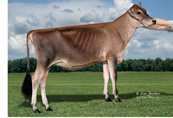
KCJF Magician Amaze