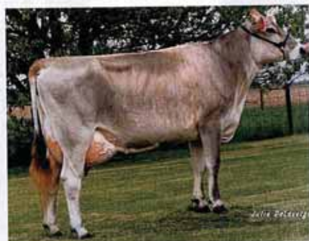
Top Acres Prophet Bloom, begehrte Bullenmutter in den 90er-Jahren.