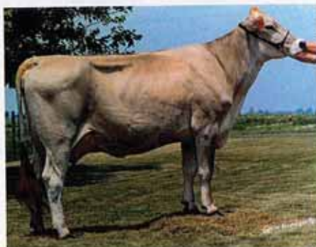
Top Acres Mono Buffy ist eine Tochter von PR Blossom. Sie war zweimal als All American nominiert.