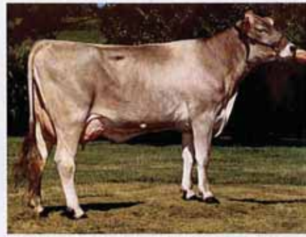
Top Acres Even Bounty, Mutter von Brinks.