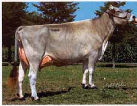
Top Acres Even Bounce, Großmutter von Payssli.