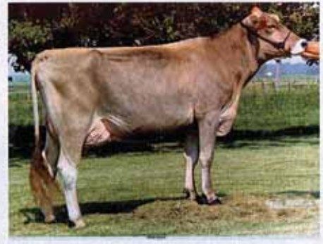
Top Acres Prelude Bouquet, Mutter von Big Boy.