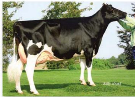
Exterieur der Marke Zip: Die am höchsten eingestufte Tochter von Zip auf Windsor-Manor ist Windsor-Manor ZeRoyal EX-92. Ihre Durham-Tochter wird demnächst abkalben, und sie hat zwei jüngere Sanchez-Töchter.