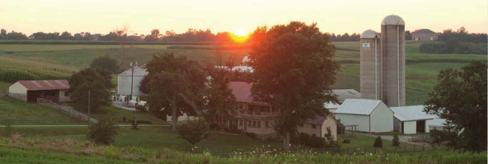
Das Zuhause eines Champions in Sachen Genetik: Windsor-Manor Rud Zip EX-95, eine der wirklich großartigen Zuchtkühe der Rasse, ist im Stall von Windsor-Manor in Maryland zuhause.