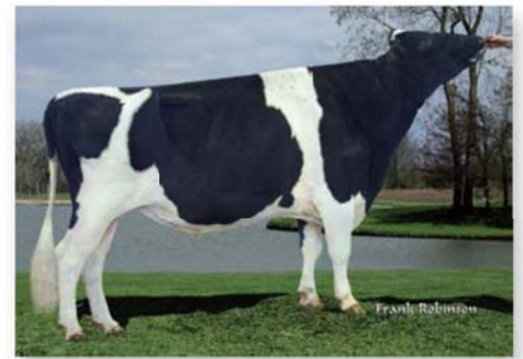
Zips Sohn ZManner ist der zweithöchste BW Marshall-Sohn in den USA und belegt Platz 64 der offiziellen Top 100-Liste nach TPI. Der höchste ist Toystory auf Platz 57.

hört sie Regancrest und A.L.H Genetics. „Durham hat bei uns einen sehr guten Job gemacht. Von den 44 Töchtern, die wir im Zeitraum von etwa fünf Jahren gezogen haben, wurden elf EX eingestuft. Dennoch sehe ich Elevation und Shottle in unserer Herde vorn. Sie waren sich ungemein ähnlich in der Art und Weise, wie sie sich vererbt haben. Und hinter diesen beiden kommen dann Durham und Blackstar.“ Eine der sechs VG eingestuft Töchter von Z-Delight ist Miss Elegant Delight VG-88. Diese Elegant-Tochter mit hohem Zuchtwert hat etliche Söhne in der Besamung und war für Embryonen und Töchter extrem gefragt. Eine weitere Elegant namens Regancrest-BH Delica ist auch VG-88, und dann sind da noch die Toystory-Tochter Regancrest-BH TS Delite VG-86 und die VG-86 eingestufte Baxter-Tochter Regancrest-BH Daphane.