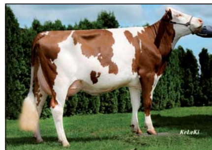
Valfin JB Brume