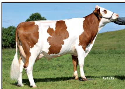
Valfin JB Belle