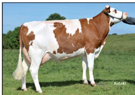
Valfin JB Beauté