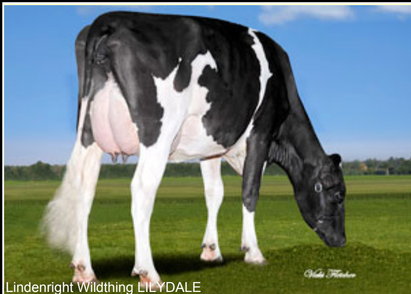
Lindenright Wildthing LILYDALE

V: MARION Veazland MARION ET BLF CVF M: 2nd WIND Gillette Blitz 2nd WIND ET MV: BLITZ Fustead Emory BLITZ ET BLF CVF