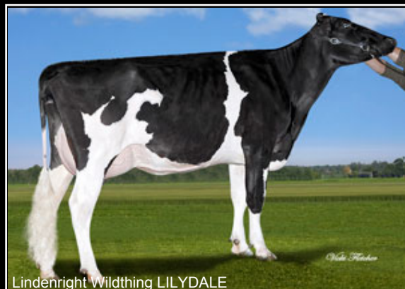
Lindenright Wildthing LILYDALE