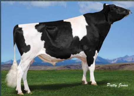
Gillette WILDTHING (EX-EXTRA) 250H00903 CANM7816547 aAa 531