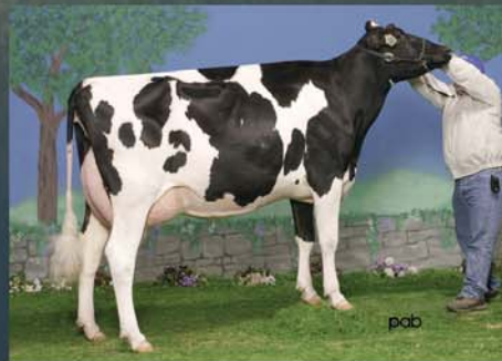
Dam: Gillette Blitz 2nd Wind (VG-88 27*) Also dam of #1 Type Bull Windhammer