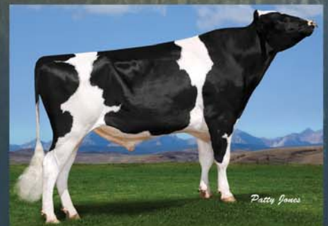
Gillette WILLROCK (EX-EXTRA) 250H00902 CANM7816548 aAa 234