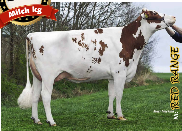
M: RED RANGE