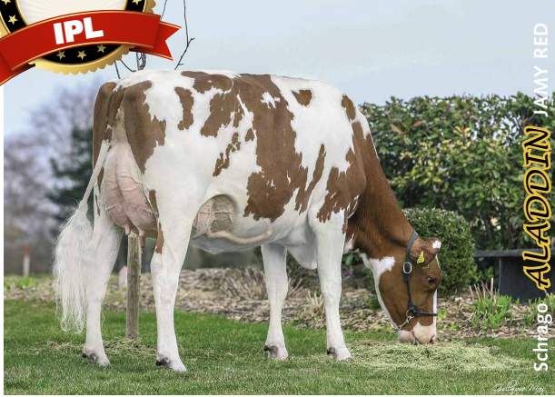
Schnägo ALADDIN JAMY RED